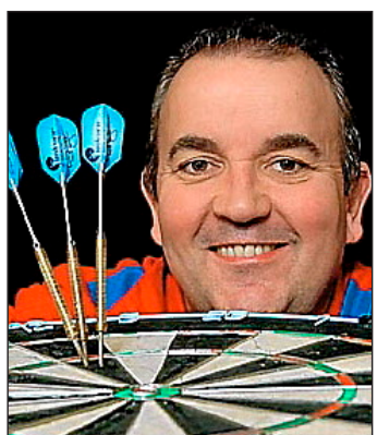
Phil Taylor ist der „König des Kneipensports“.

Der beste Dart-Spieler der Welt wird nicht müde, in Deutschland Entwicklungshilfe zu leisten und die Ernsthaftigkeit seines Tuns zu betonen. Täglich drei Stunden und länger trainiert der Champion und wirft währenddessen die 26 Gramm schweren Pfeile hunderte Male aus 2,37 Metern Entfernung auf die Scheibe. 200 000 Würfe sind es pro Jahr, sagt er. Übung macht den