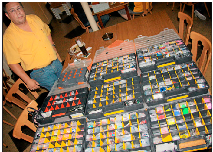
Eine Wissenschaft für sich ist das Sportgerät: André Hill, Spieler beim Verein „Double Trouble“ in Wetzlar und Mitglied der E-Dart-Mannschaft von Völlischdanewe, handelt mit Einzelteilen für die Pfeile.